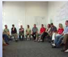
Trainingsgruppe im Jahr 2005 in der JVA in Magdeburg