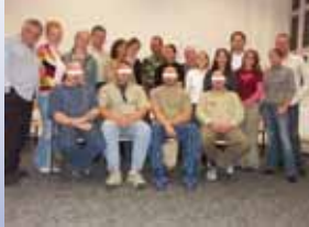
Trainingsgruppe im Jahr 2005 in der JVA Magdeburg