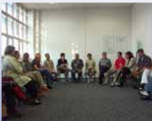
Trainingsgruppe im Jahr 2005 in der JVA Magdeburg