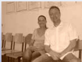
Trainerteam im Jahr 2006 in der JVA in Magdeburg