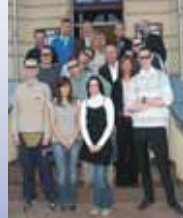
Trainingsgruppe im Jahr 2007 im ambulanten Bereich in Magdeburg